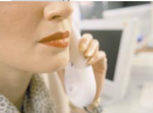
Wiederverwertung nehmen wir ganz genau.