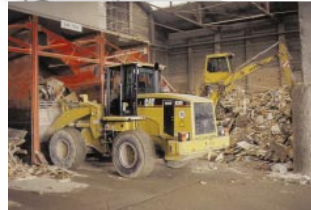
Großanlage zum Sortieren gemischten Materialien.