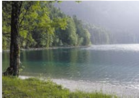
Wir schützen die Umwelt durch Recycling